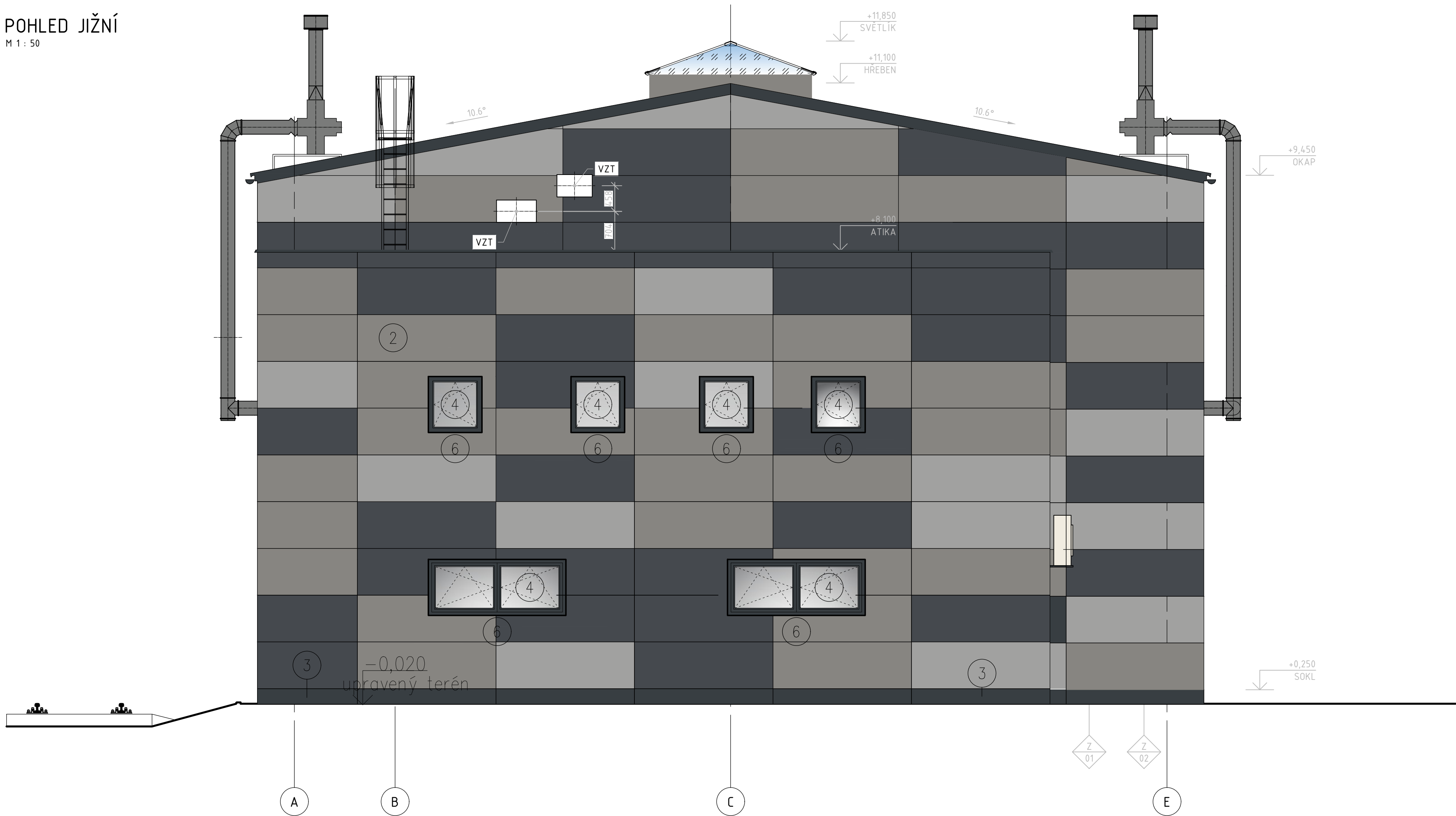
POHLED JIŽNÍ M 1 : 50